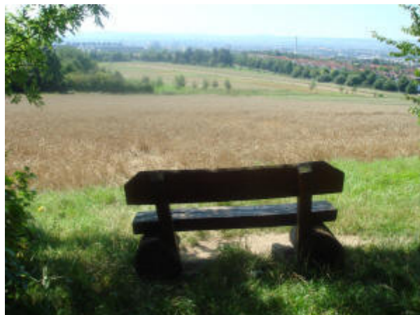
Göttingen vista desde la quietud. Foto E.S. 2007.

“El ciclo sin fin de ideas y acciones, invención sin fin, experimentación sin fin nos hacen conocer el movimiento, pero no la quietud. Conocimiento del discurso, pero no del silencio. ¿Dónde está la vida que perdimos viviendo? ¿Dónde está la sabiduría que perdimos al conocer? ¿Dónde está el conocimiento perdido con la información?”