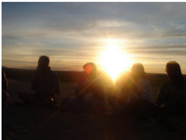
Meditación al atardecer.

Muchos grupos y personas preparan una gran meditación colectiva el día 17 de julio a las 11:11 de la mañana con la intención de crear una conciencia colectiva y humana focalizada en un mundo de rectas relaciones y armonía. Este tipo de actos pacíficos fortalecen el concepto de nueva cultura y nueva ética para un mundo mejor.