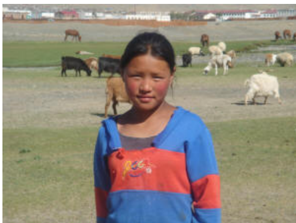
Niña pastora en el desierto del Gobi, Mongolia.

Ya son muchos los ciudadanos del primer mundo que optan por unas vacaciones solidarias en países en vías de desarrollo. Muchos de estos países agradecen la visita de turistas llenos de dinero, el cual supone para ellos una importante fuente de ingresos. Pero existe una alternativa aún más comprometida, en la cual puedes invertir tu tiempo y tu dinero en acciones solidarias. No dejes escapar la oportunidad de vivir un verano diferente.